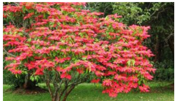
Albero della Stella di Natale (Euphorbia pulcherrima)

Stella di Natale come farla rifiorire? Arrivano le feste natalizie e tra i pensierini più ricorrenti che vengono scambiati tra parenti ed amici è rappresentato dalle Schneekugel , le palle di vetro con la neve e dalla più nota Stella di Natale il cui nome esatto è Euphorbia pulcherrima o nota anche come Poinsettia.